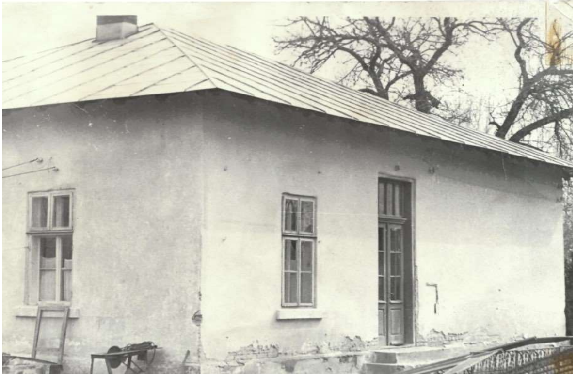
Vechiul local al școlii inaugurat în 1903